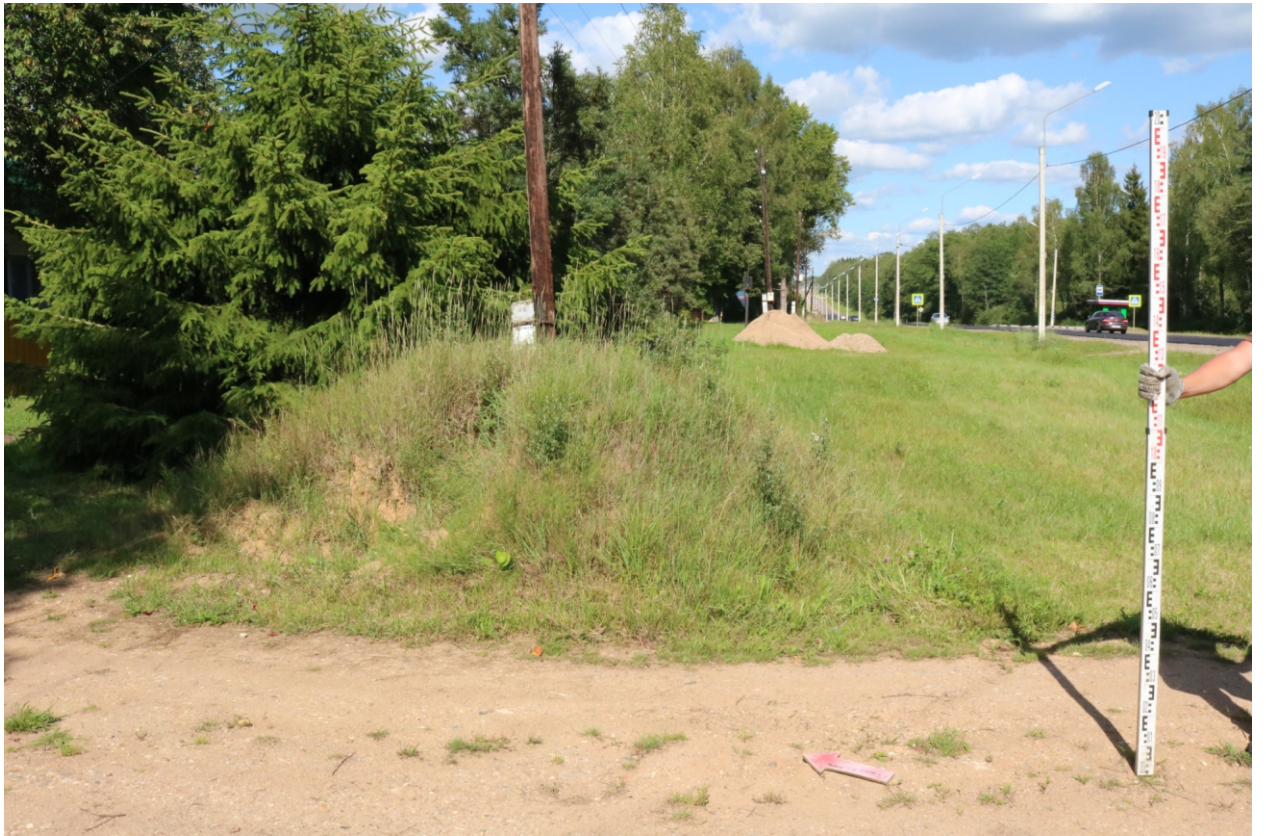
Рис. 12. Археологическое обследование участка по объекту: «Уличные газопроводы дер. Рудинка Износковского района Калужской области». 2023 г. Точка фотофиксации 3. Вид с ЮЗ.