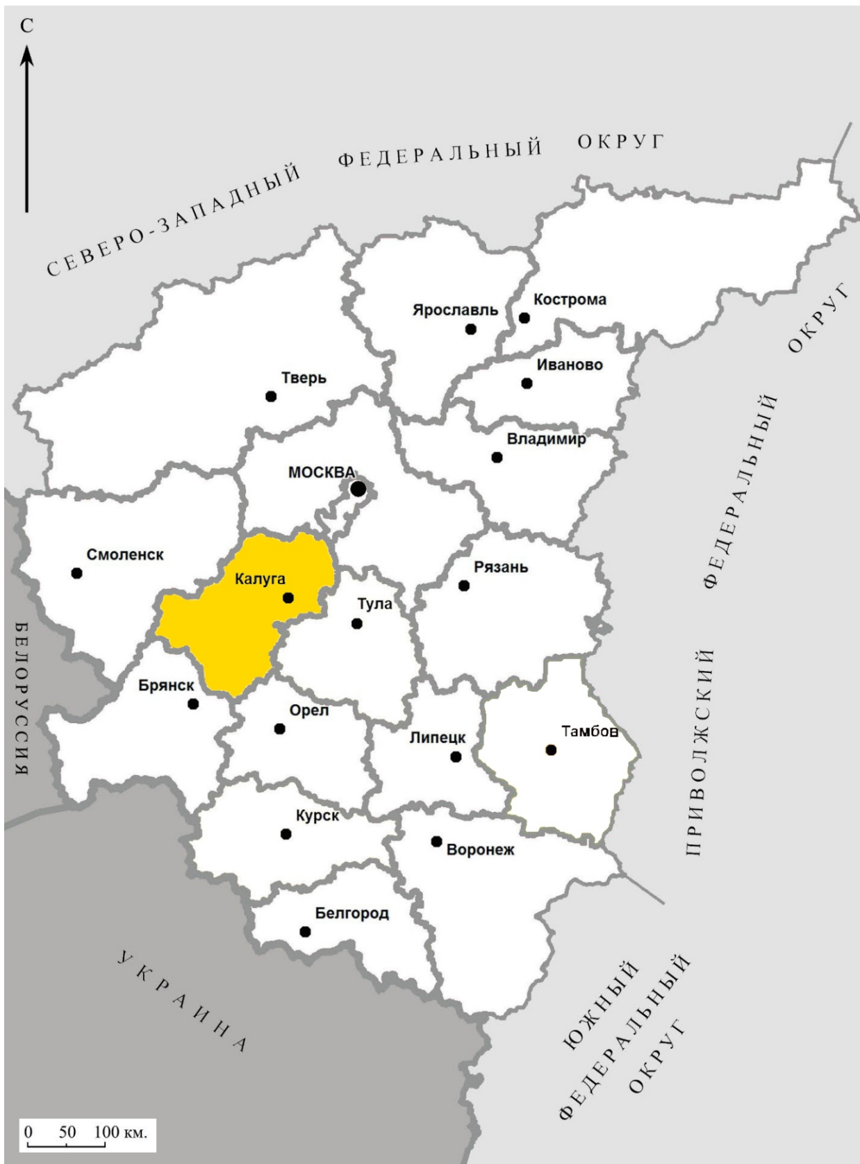
Рис. 1. Археологическое обследование участка по объекту: «Уличные газопроводы дер. Рудинка Износковского района Калужской области». 2023 г. Калужская область на схеме Центрального федерального округа.