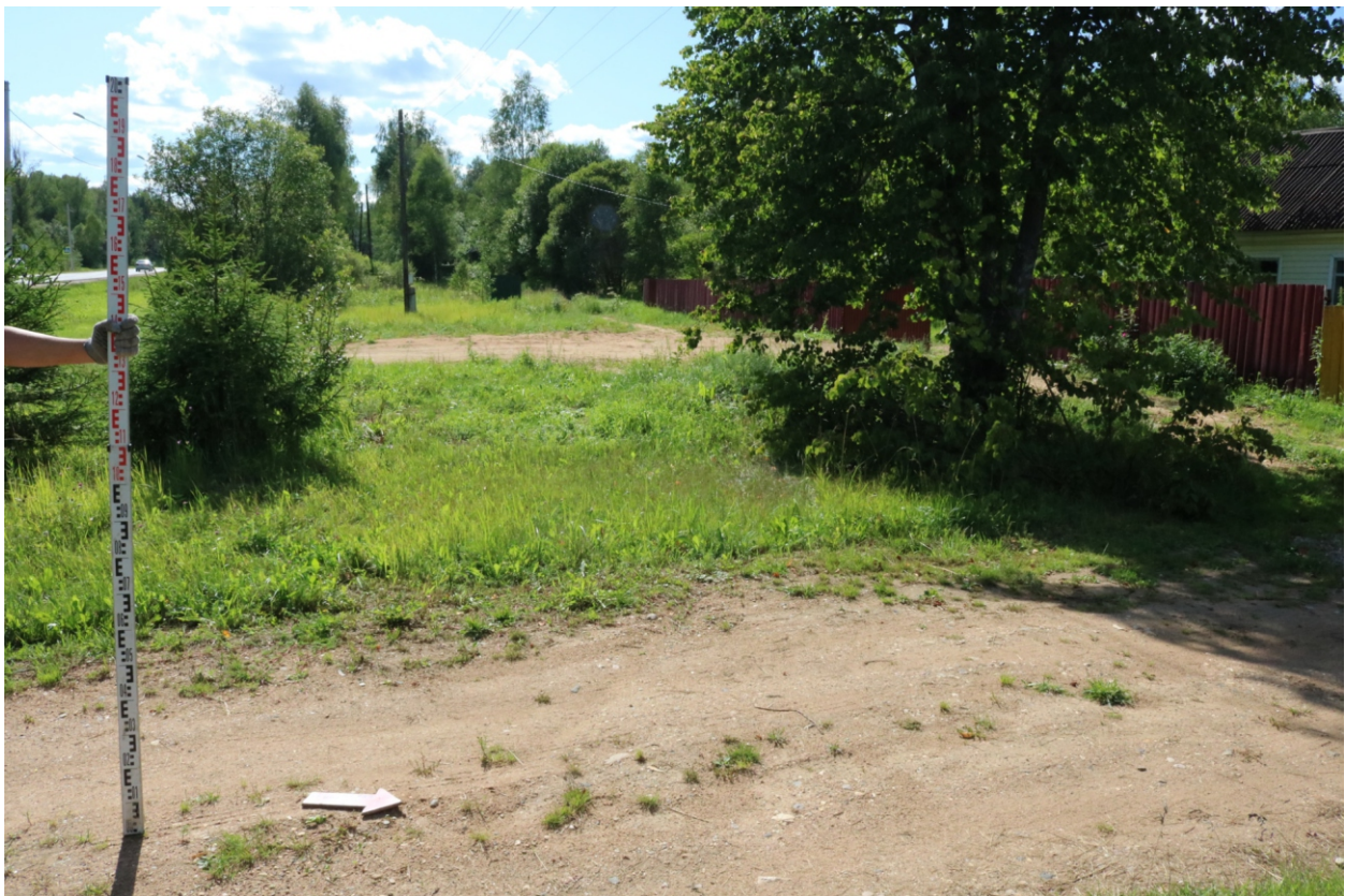
Рис. 13. Археологическое обследование участка по объекту: «Уличные газопроводы дер. Рудинка Износковского района Калужской области». 2023 г. Точка фотофиксации 3. Вид с СВ.