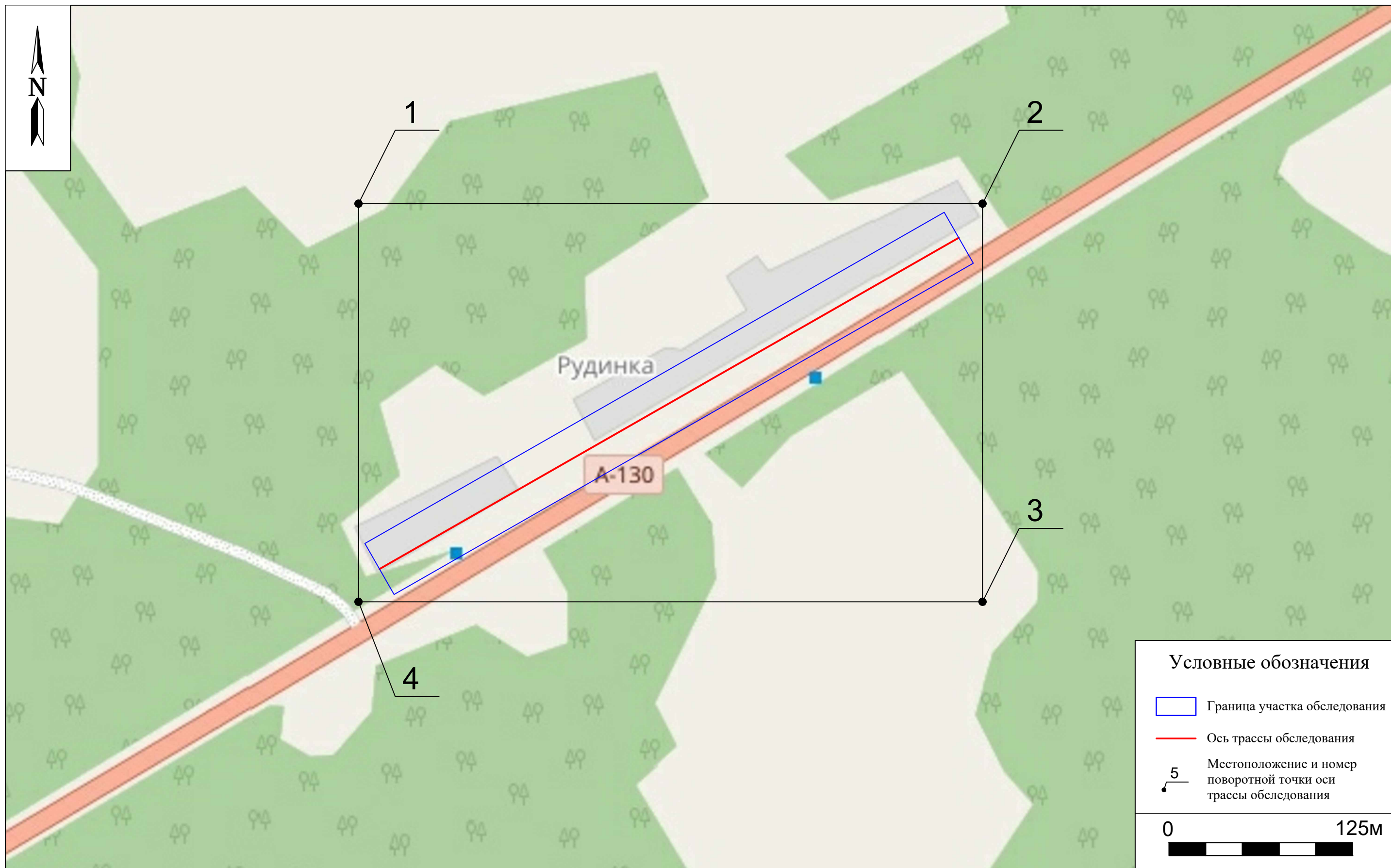
Рис. 6. Археологическое обследование участка по объекту: «Уличные газопроводы дер. Рудинка Износковского района Калужской области». 2023 г. Ситуационный план местности с указанием границ участка обследования и местоположением поворотных точек.