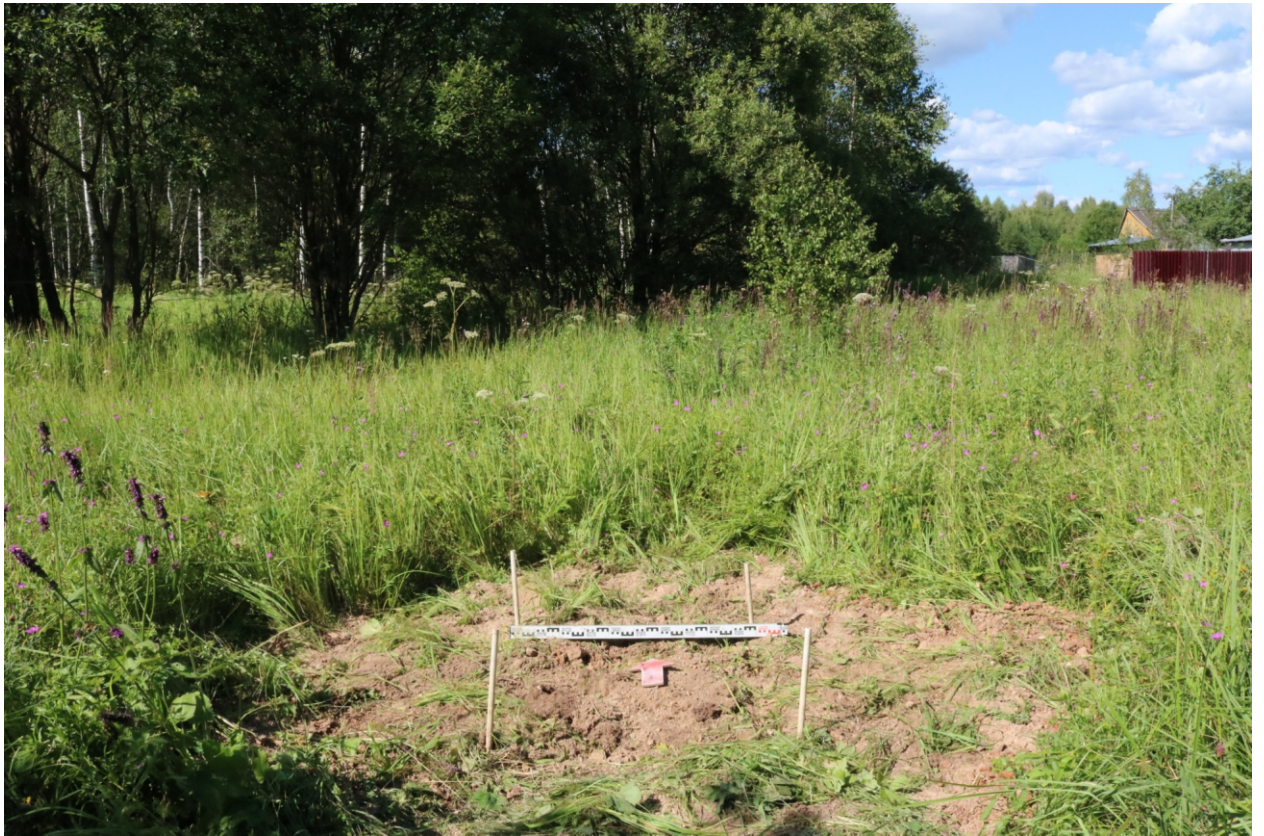
Рис. 20. Археологическое обследование участка по объекту: «Уличные газопроводы дер. Рудинка Износковского района Калужской области». 2023 г. Шурф 1. Рекультивация. Вид с Ю.