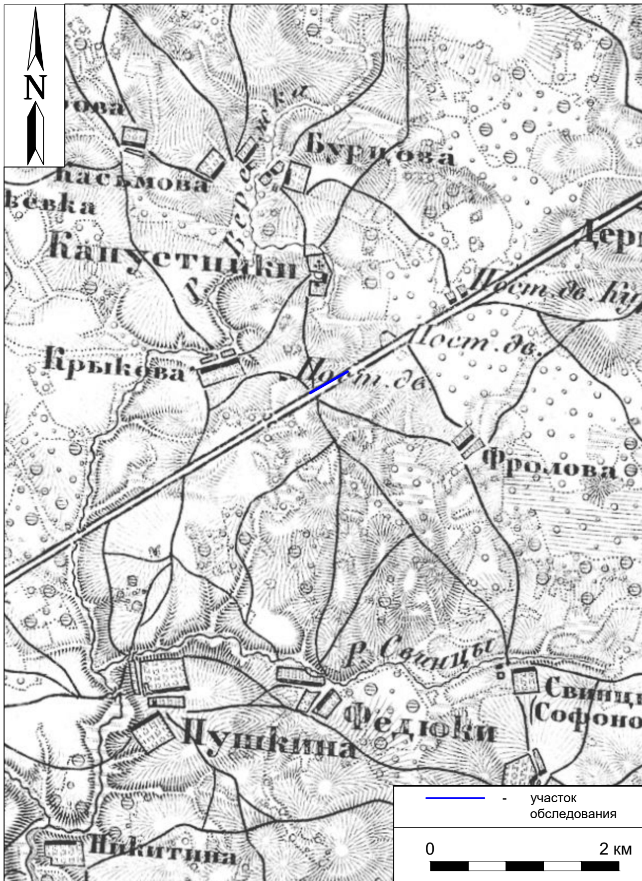
Рис. 5. Археологическое обследование участка по объекту: «Уличные газопроводы дер. Рудинка Износковского района Калужской области». 2023 г. Военно-топографическая карта Калужской области 1868 г. с указанием участка обследования.