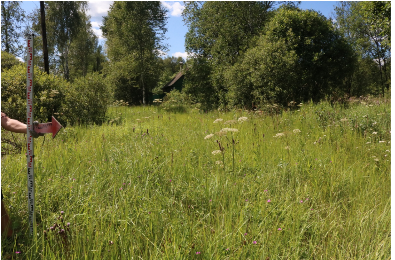
Рис. 9 . Археологическое обследование участка по объекту: «Уличные газопроводы дер. Рудинка Износковского района Калужской области». 2023 г. Точка фотофиксации 1. Вид с СВ.