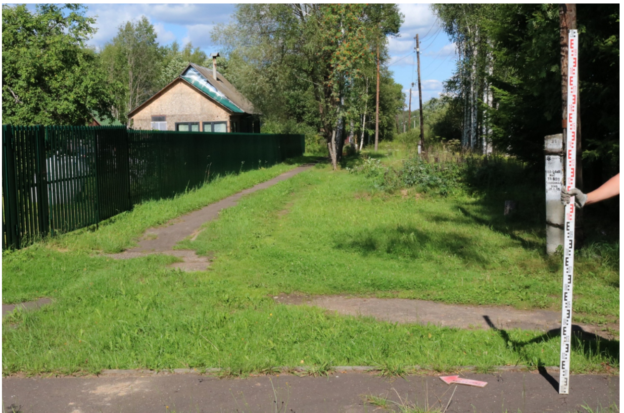
Рис. 11. Археологическое обследование участка по объекту: «Уличные газопроводы дер. Рудинка Износковского района Калужской области». 2023 г. Точка фотофиксации 2. Вид с ЮЗ.