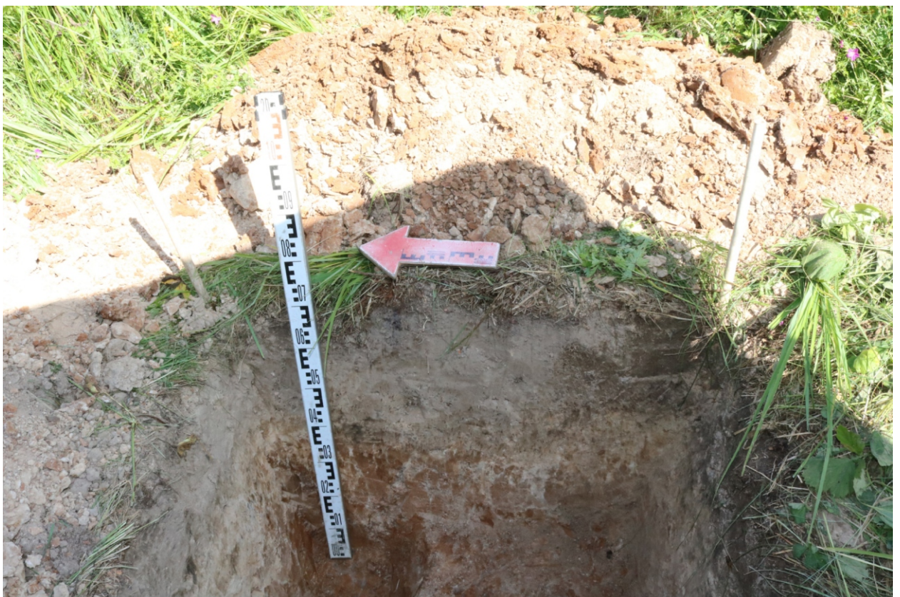
Рис. 19. Археологическое обследование участка по объекту: «Уличные газопроводы дер. Рудинка Износковского района Калужской области». 2023 г. Шурф 1. Восточный борт (контрольный прокоп). Вид с З.