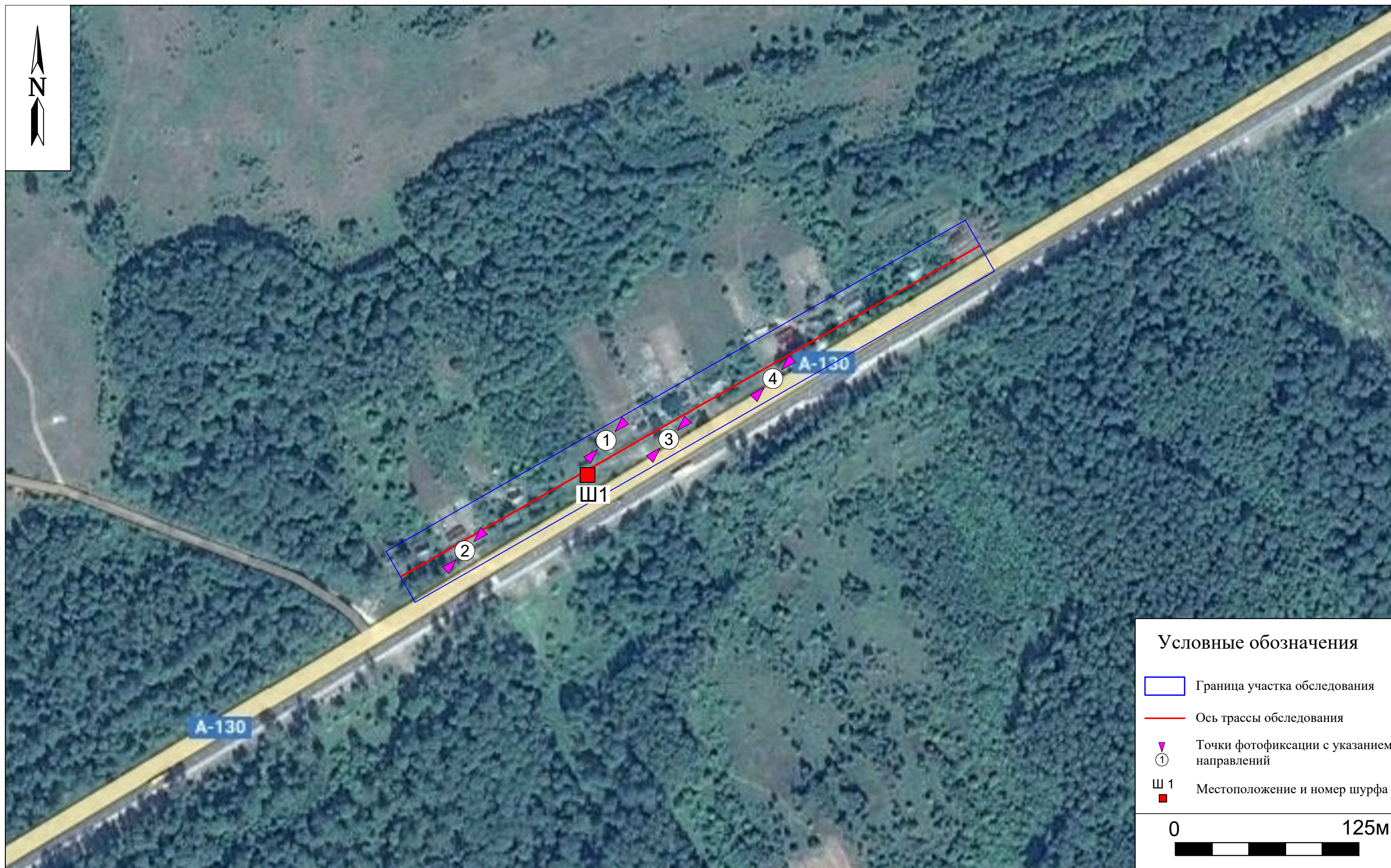
Рис. 7. Археологическое обследование участка по объекту: «Уличные газопроводы дер. Рудинка Износковского района Калужской области». 2023 г. Ось трассы обследования на космоснимке 2022 г. с указанием местоположения точек фотофиксаций и шурфов.