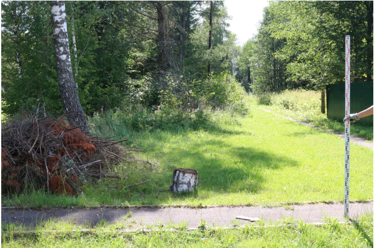
Рис. 10. Археологическое обследование участка по объекту: «Уличные газопроводы дер. Рудинка Износковского района Калужской области». 2023 г. Точка фотофиксации 2. Вид с СВ.