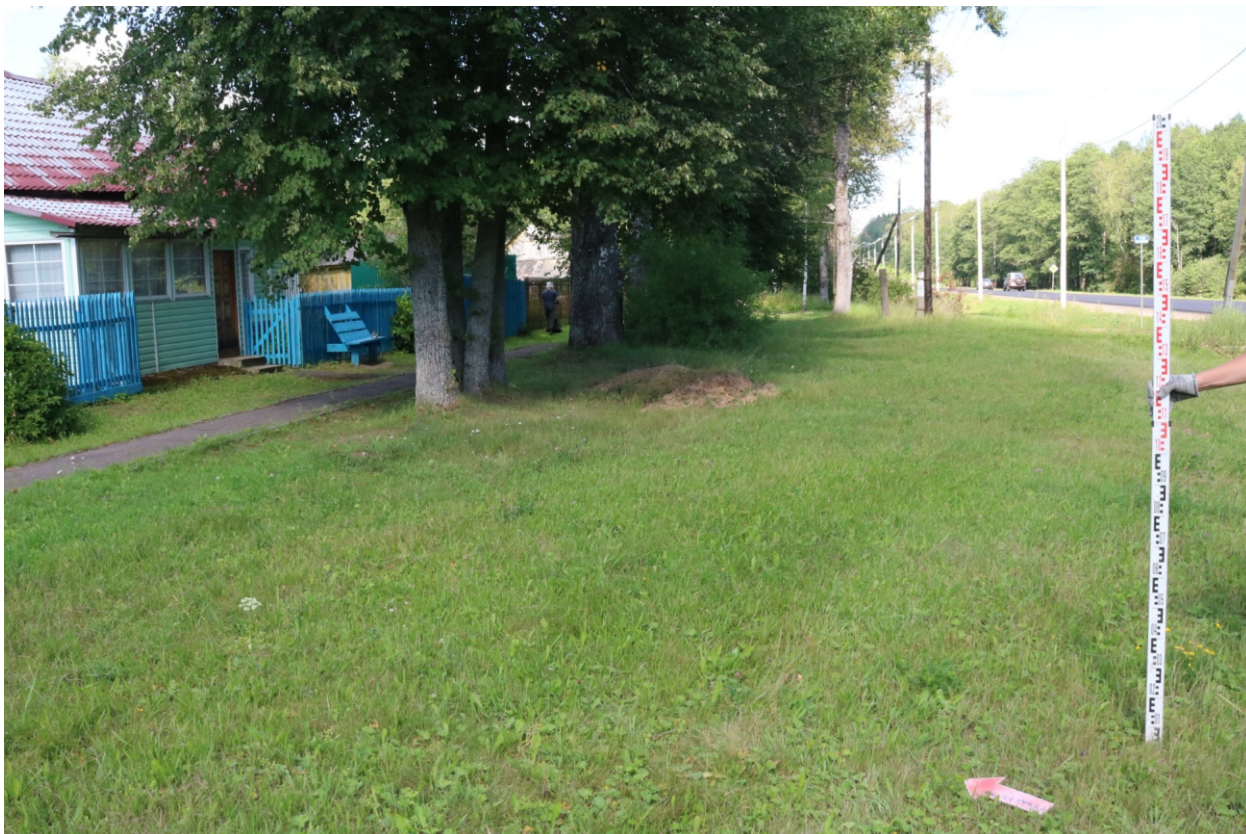
Рис. 14. Археологическое обследование участка по объекту: «Уличные газопроводы дер. Рудинка Износковского района Калужской области». 2023 г. Точка фотофиксации 4. Вид с ЮЗ.