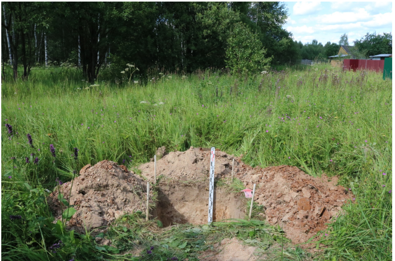
Рис. 17. Археологическое обследование участка по объекту: «Уличные газопроводы дер. Рудинка Износковского района Калужской области». 2023 г. Шурф 1. Общий вид с Ю после завершения работ.