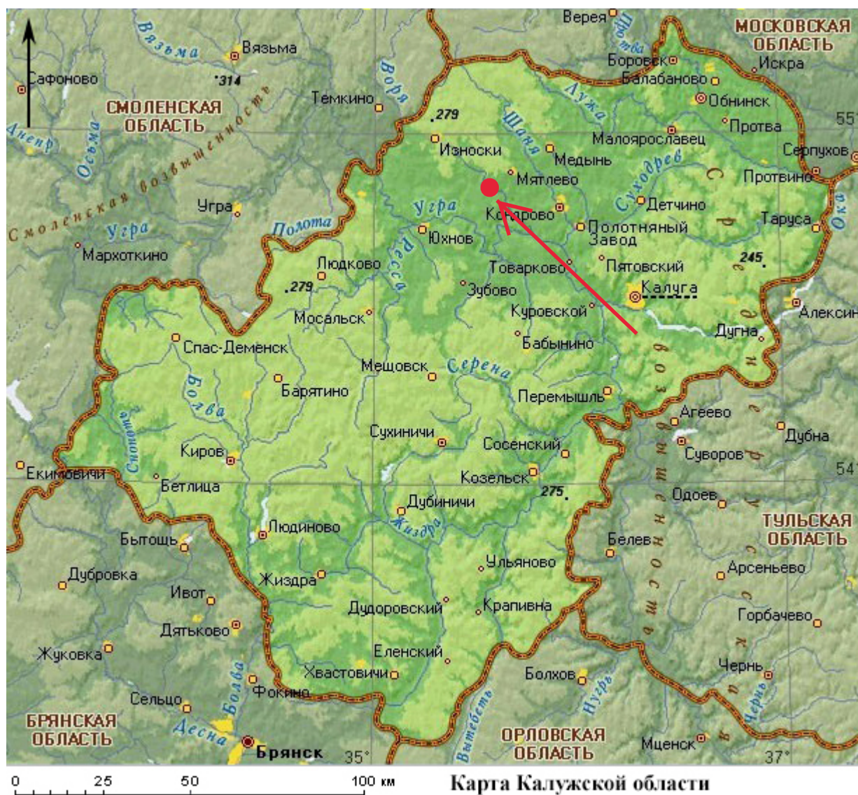
Рис. 2. Археологическое обследование участка по объекту: «Уличные газопроводы дер. Рудинка Износковского района Калужской области». 2023 г. Карта Калужской области с указанием местоположения участка обследования.