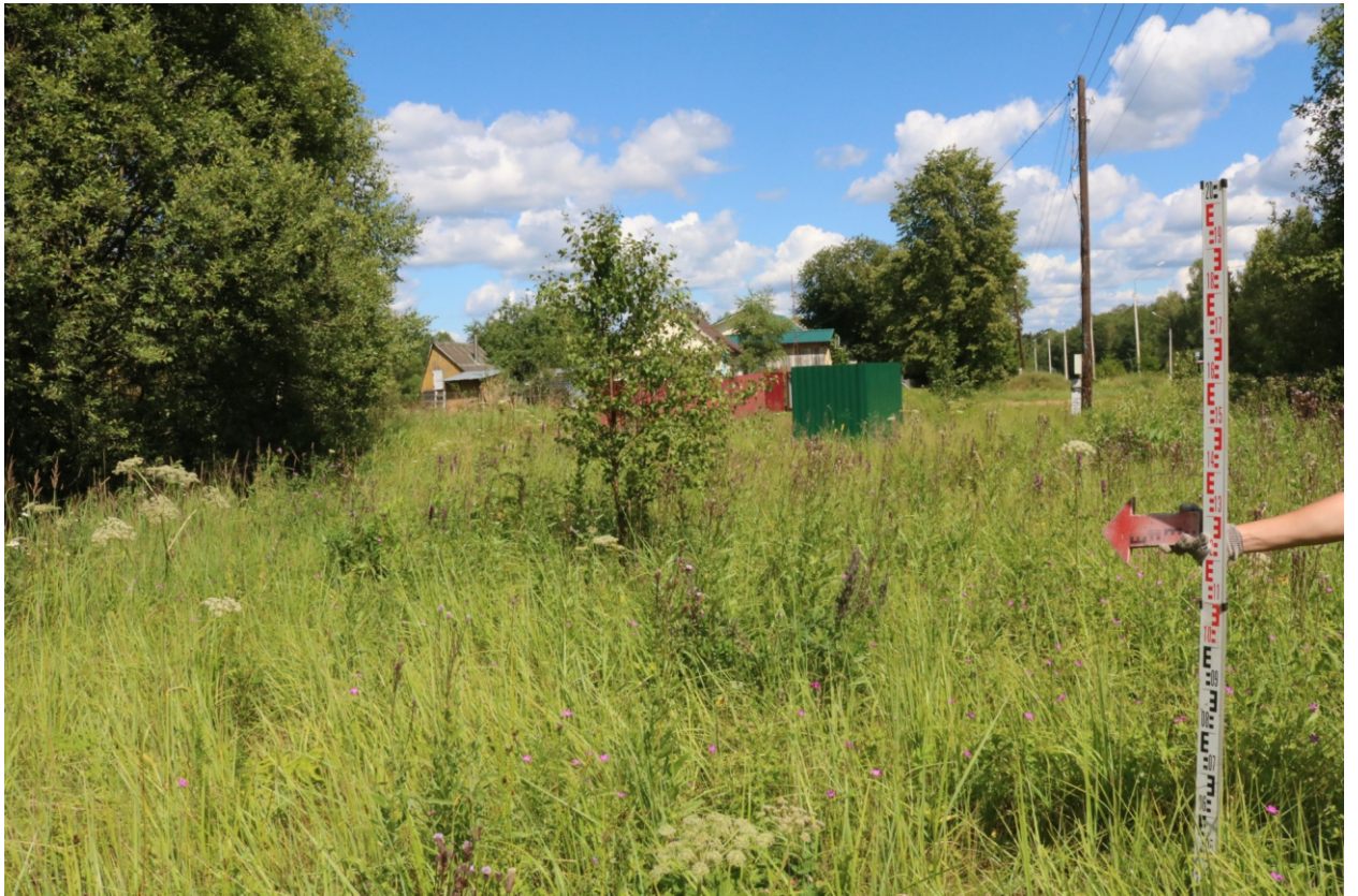
Рис. 8 . Археологическое обследование участка по объекту: «Уличные газопроводы дер. Рудинка Износковского района Калужской области». 2023 г. Точка фотофиксации 1. Вид с ЮЗ.