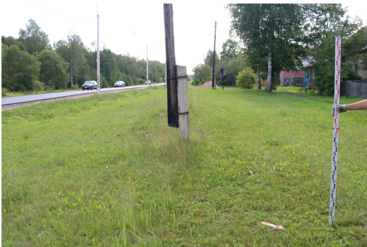
Рис. 15. Археологическое обследование участка по объекту: «Уличные газопроводы дер. Рудинка Износковского района Калужской области». 2023 г. Точка фотофиксации 4. Вид с СВ.