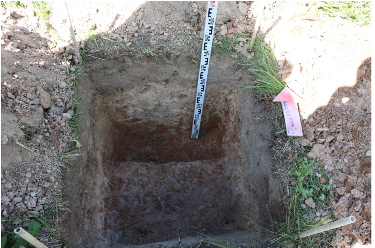
Рис. 18. Археологическое обследование участка по объекту: «Уличные газопроводы дер. Рудинка Износковского района Калужской области». 2023 г. Шурф 1. Материк (контрольный прокоп). Вид с Ю.