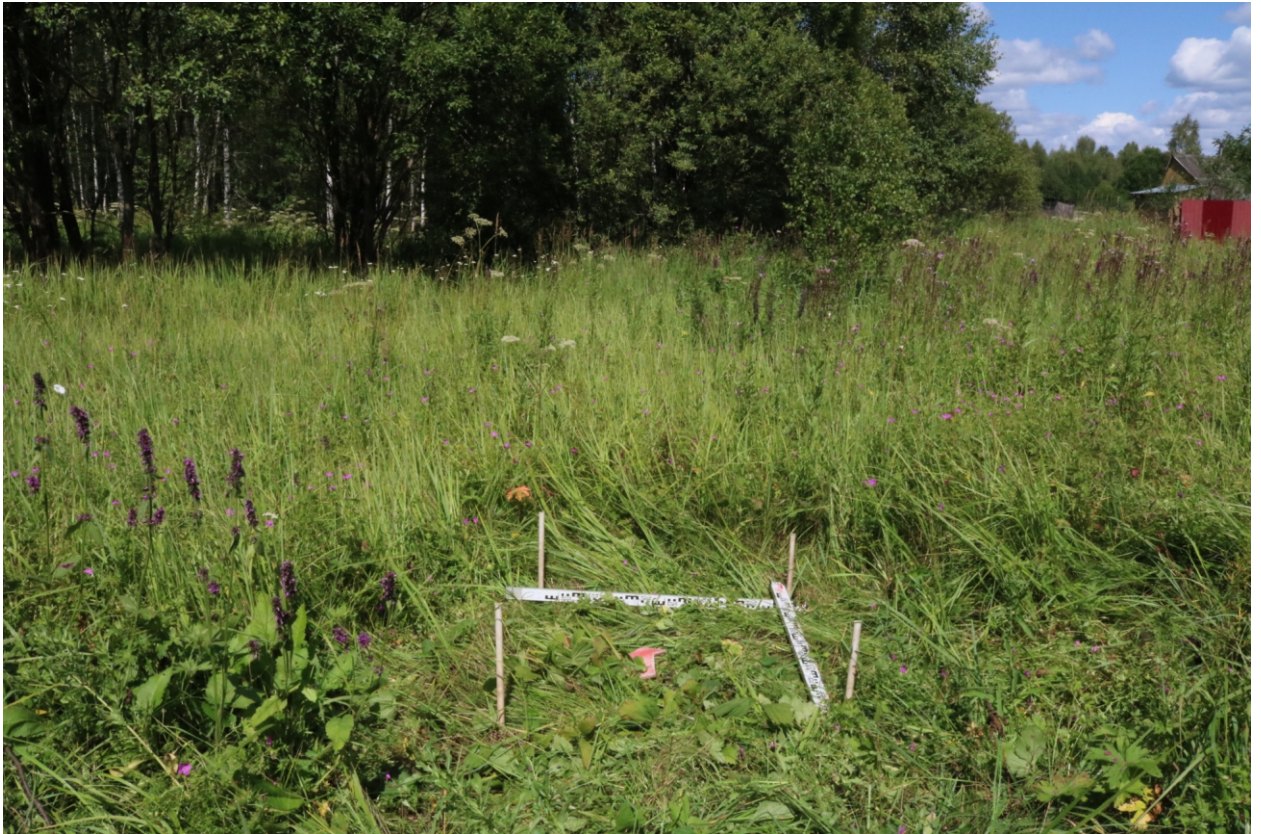
Рис. 16. Археологическое обследование участка по объекту: «Уличные газопроводы дер. Рудинка Износковского района Калужской области». 2023 г. Шурф 1. Общий вид с Ю до начала работ.